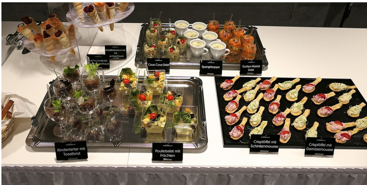
Zu einer gelungenen Eröffnungsfeier gehört ein gediegener Apéro Bild: