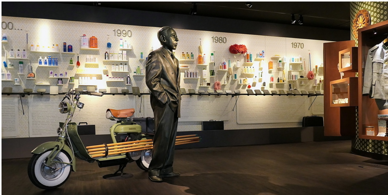
Impressionen aus dem Just-Museum...

Referenz: 80885820 Ausschnitt Seite: 7/12