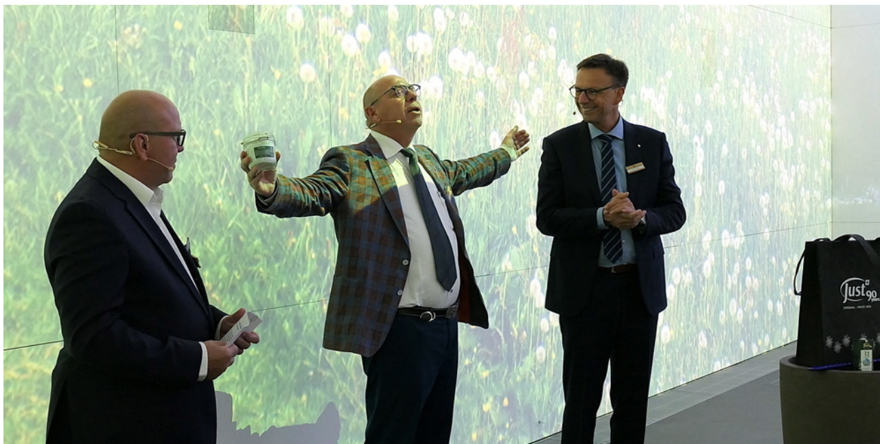
Die JUST-Gruppe umarmt die ganze Welt