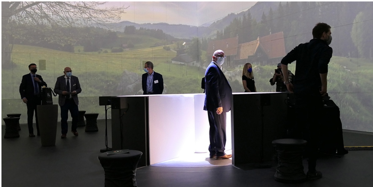
Der Abgang mitten im Raum führt zum Just-Museum Bild: