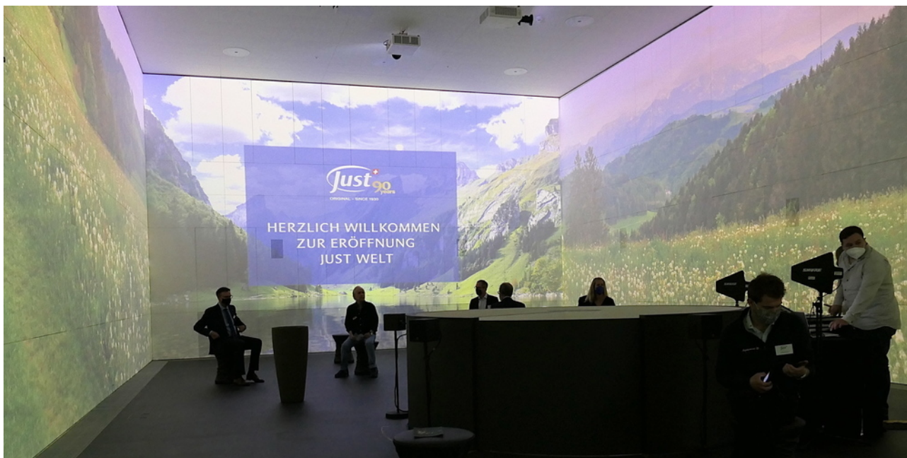
Garantiert eine neue Touristenattraktion für Walzenhausen und das gesamte Appenzell.